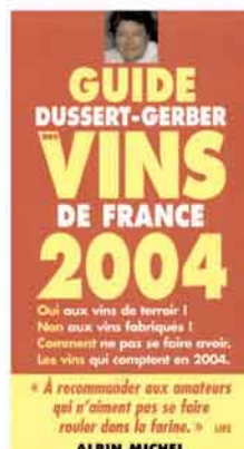
Guide Dussert-Gerber Edition 2004